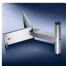
23.0240.00 SCREEN-AGE Eck-Halterung AUSSEN spannbar

SCREEN-AGE Wall holder EXTERNAL corner tensionable