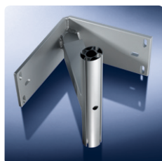
23.0241.00 SCREEN-AGE Eck-Halterung INNEN spannbar

W: 13,39 inch H: 16,54 inch L: 11,81 inch 2640 g PU: 1