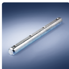
36.1215.01 Schienenverbinder Stahl verzinkt L=150 mm Inkl. 6-Kant-Schlüssel passend für den SIGN-WARE®-Kederkanal

Ø: 1,97 inch L: 236,22 inch 9810 g PU: 1